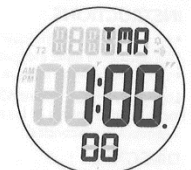
MODE COMPTE À REBOURS

Remarque : Si aucune opération n'est effectuée, le réglage sera enregistré et le chronomètre entrera automatiquement en mode Compte à rebours.